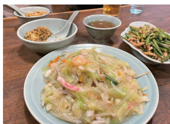
中国料理 西海 住所：京都府京都市伏見区深草キト口33-7 Tel: 075-642-6161 営業時間：11:00 ~ 15:00 (昼)

あ けましておめでとうござ います。今年も「good」を 何卒よろしく願います。 午前中にお参りにきました。 人は思ったより多くなくて、 スムーズに参拝をすることが できました。おみくじは「大 吉」で、幸先の良いスタートを 切れたと感じています！今年 は、たくさんお仕事ができる年 になるよう精進したいです。 ひと通り見た後は、「千本鳥 居」をぐぐりました。鳥居の間 から差し込む光は幻想的で、 朱塗りが綺麗に感じました。 年末年始に食べすぎたことも あり、山歩きが辛かったです(笑) 途中、小腹が空いたので稲荷 寿司を食べて、下山し、近くの 中華屋さん「西海」に行き、歩 いた分たんさん食べました。