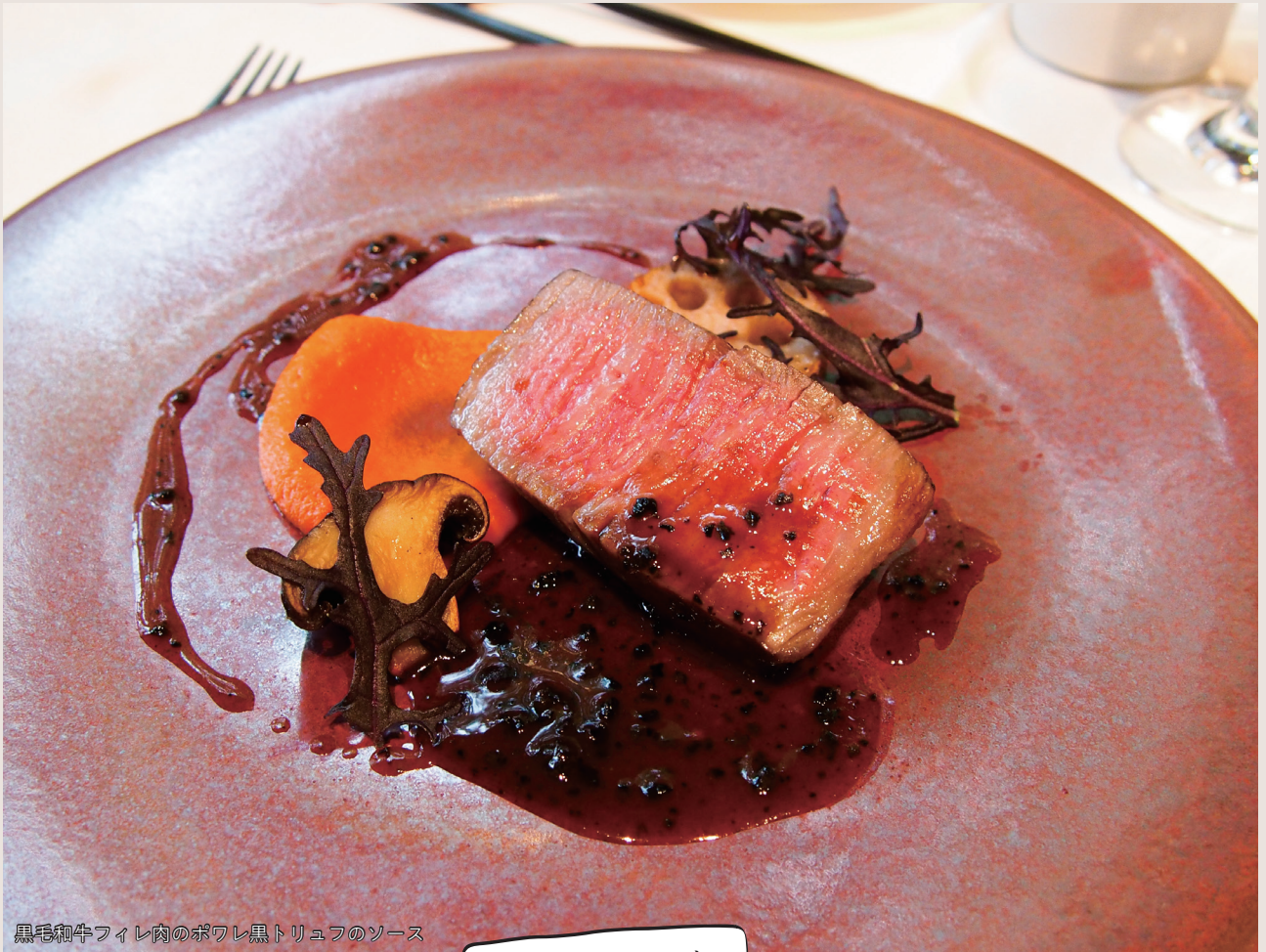
黒毛和牛フィレ肉のポワレ黒トリュフのソース