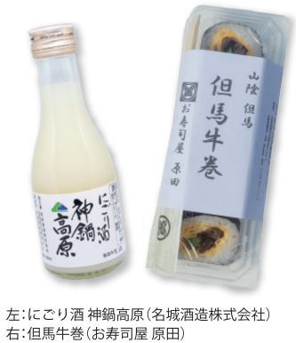
左:にこり酒 神鍋高原(名城酒造株式会社) 右:但馬牛巻(お寿司屋 原田)

夜は冷え込み、吐く息は白くなる。キャンプ飯+寒い時の暖かい飯は感動。五臓六腑に染み渡るなんて言葉があるが、まさにそれを体験できるのが冬の「おでん」だと思う。食べた商品は丸善の「海鮮炊きおでん」で、具材は鱈の角揚げ、たこの団子、鱈のつみれ、玉子、大根、昆布、こんにゃくが各2個入っていた。海鮮の出汁がしっかり染み込んで美味しかった。残った出汁はワンカップの出汁割でいただき、メは肉まんを食べ、おつまみのスモークタンはおでんができるまでのビールのおともでいただきました(笑)。キャンプの帰りに道の駅「神鍋高原」でお昼ご飯の「但馬牛巻」とお土産の「にこり酒 神鍋高原」を購入。素敵な思い出になりました！