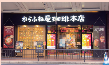
からふね屋珈琲三条本店

住所: 京都府京都市中京区河原町通三条下大黒町39 Tel: 075-254-8774 営業時間: 9:00~23:00 ※ラストオーダー22:00