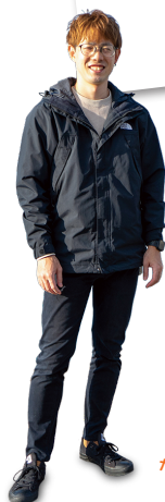
食べ過ぎちゃった