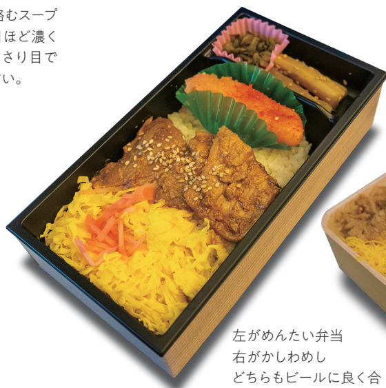
左がめんたい弁当 右がかしわめし どちらもビールに良く合う味付けで美味!

住所：福岡市博多区博多駅中央街9-1 KITE博多B1 Tel: 092-260-6315 営業時間：11:00 ~ 24:00