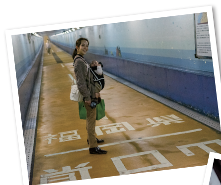
関門トンネル人道の福岡と山口の県境 なんと海の中

ことのできる周辺を散策しつつ、山口に向けて歩きました。「関門橋」の下には人道トンネルという海底トンネルが通っているのので、海の下を歩いて山口まで行くことができます。門司港から関門橋が近くに見えたので、歩いたら40分もかかりました…(笑)人生初海底トンネルはテンションが上がりましたが、海の底だと考えると怖かったです。山口についてからは、奥さんのおばあちゃんのお家で一泊しました。