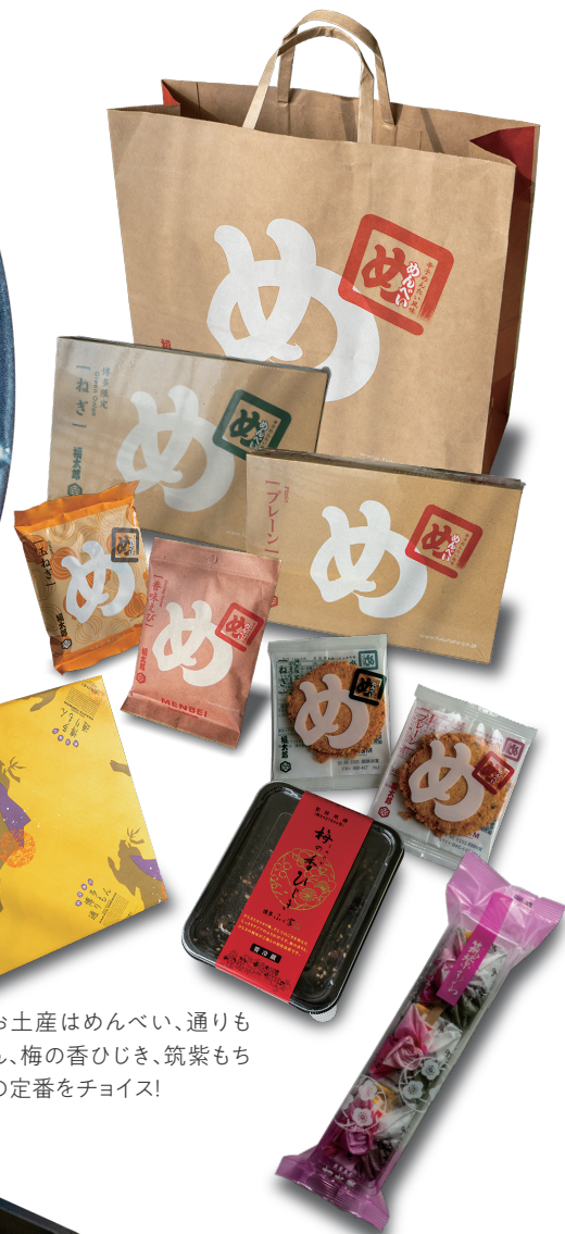
お土産はめんべい、通りもん、梅の香ひじき、筑紫もちの定番をチョイス!