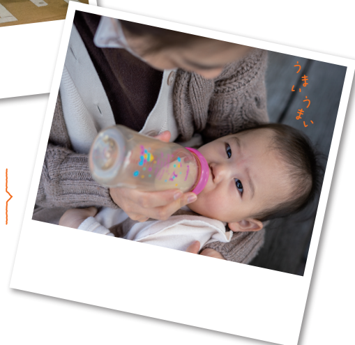
レト口門司で海を眺めながら優雅に授乳