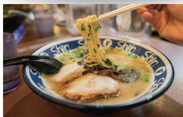
細麺に絡むスープは見た目ほど濃くなくあっさり目で食べやすい。