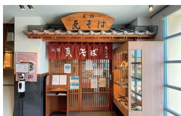
元祖 瓦そば たかせ「門司港レト口店」 住所: 福岡県北九州市門司区港町5-1海峽プラザ西館2F Tel: 093-322-3001 営業時間: 9:00 ~ 17:00 (月・火定休日)