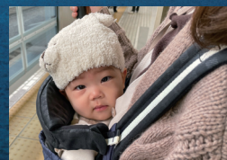
新幹線を待つ娘ちゃん

京都から山口まで新幹線で2時間ちよつと。お昼には着きたかったので、朝早くのバスに乗って京都駅へ。娘ちゃん初の新幹線に乗って向かいました。ホームにいた時は若干不安そうなおな表情でしたが、新幹線の揺れが気持ちよかったのか30分くらいしたら、うとうととして着くまでぐっすり眠っちゃいました。当初は「ぐずっちゃったらどうしよう」とか不安がありました。寝るのが早過ぎて笑っちゃいました(笑)