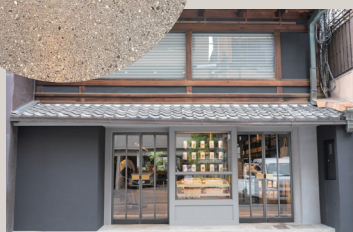
小川珈琲 堺町錦店

住所: 京都府京都市中京区菊屋町519-1 Tel: 075-748-1699 営業時間: 7:00 ~ 20:00